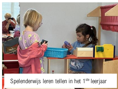
Spelenderwijs leren tellen in het 1 st e leerjaar

Op woensdag 13 december tussen 8u00 en 8u15 kan je weer speelgoed, boeken en strips brengen voor het goede doel. We verzamelen alles in de eethoek van de lagere school en brengen het daarna naar organisatie ' De Watertoren ' in Beerse; zij bezorgen alles aan gezinnen die het financieel wat moeilijker hebben. Help jij ook mee om alle kinderen een fijn eindejaarsfeest mét pakjes te geven? https://www.de-watertoren.be/