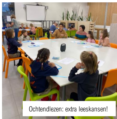
Ochtendlezen: extra leesansen!

We kregen het bericht vanuit Spanje dat de Heilige Man een bezoekje aan onze school brengt op 5 december .